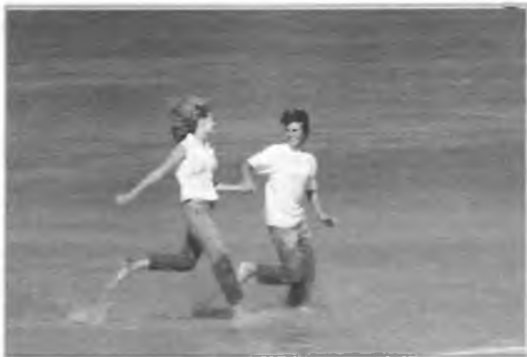
Отдых на берегу моря

Для удовлетворения полового влечения требуется только сексуальная активность; в любви же сексуальная активность является вторичной по отношению к тем чувствам, которые один человек испытывает к другому.