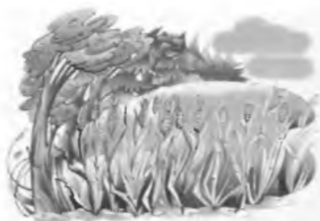
Лесополоса в степи

кациях и в населенных пунктах в горной местности. Для смягчения эрозивных процессов используются защитные лесонасаждения .