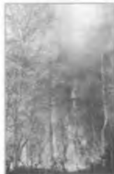
Лесные пожары в Читинской области охватили более 125 тыс. гектаров. Июнь 2003 г.