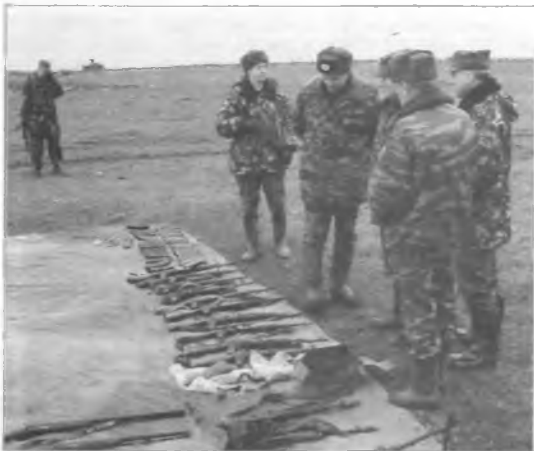
Ликвидация склада оружия и боеприпасов, принадлежащих незаконным вооруженным формированиям. Село Старые Атаги. Республика Чечня. февраль 2002 г.