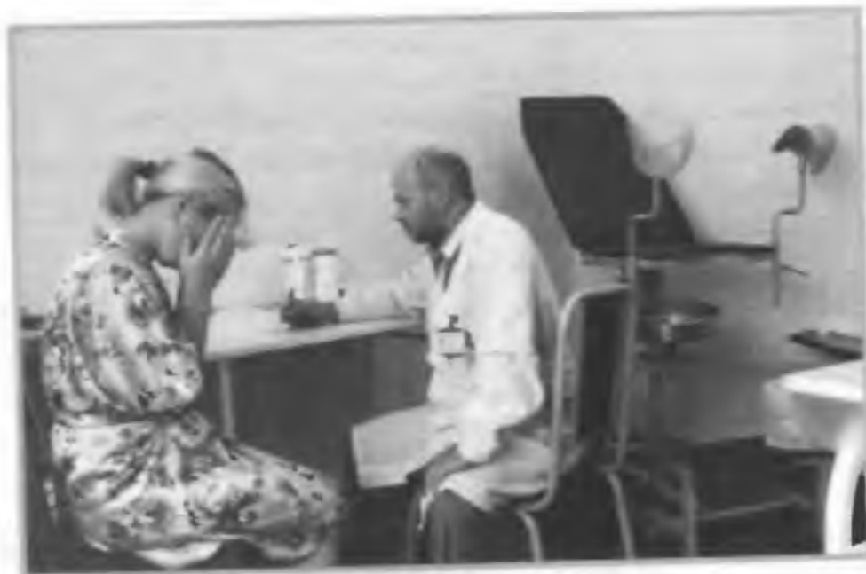
На приеме у венеролога. Челябинск, кожно-венерологический диспансер

Таким образом, ранние половые связи подростков всегда приводят к отрицательному влиянию на состояние общего здоровья подростка (духовного и физического) и репродуктивного здоровья. Причина ранних половых связей в подростковом возрасте кроется прежде всего в неправильных мотивах и жизненных установках в этом возрасте. Подросток руководствуется больше физиологическими потребностями, связанными с интенсивным половым созреванием.