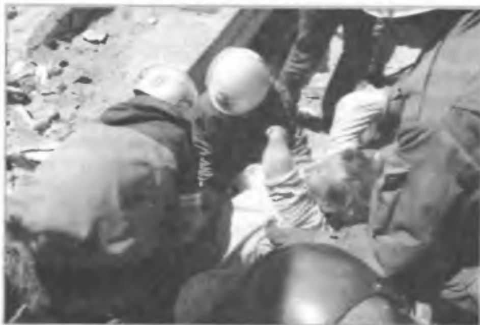
Работы по извлечению пострадавших из завалов. Сахалин. Нефтегорск. 1995 г.