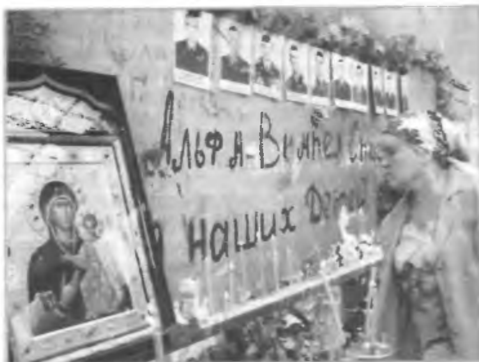
1—3 сентября 2004 г. террористы удерживали заложников в спортивном зале школы № 1 г. Беслана (Северная Осетия). При их освобождении погибли сотрудники спецподразделений

Статистические данные террористических актов, совершенных посредством применения взрывчатых веществ в Российской Федерации в период с 1996 по 2009 г., приведены в разделе «Приложение».