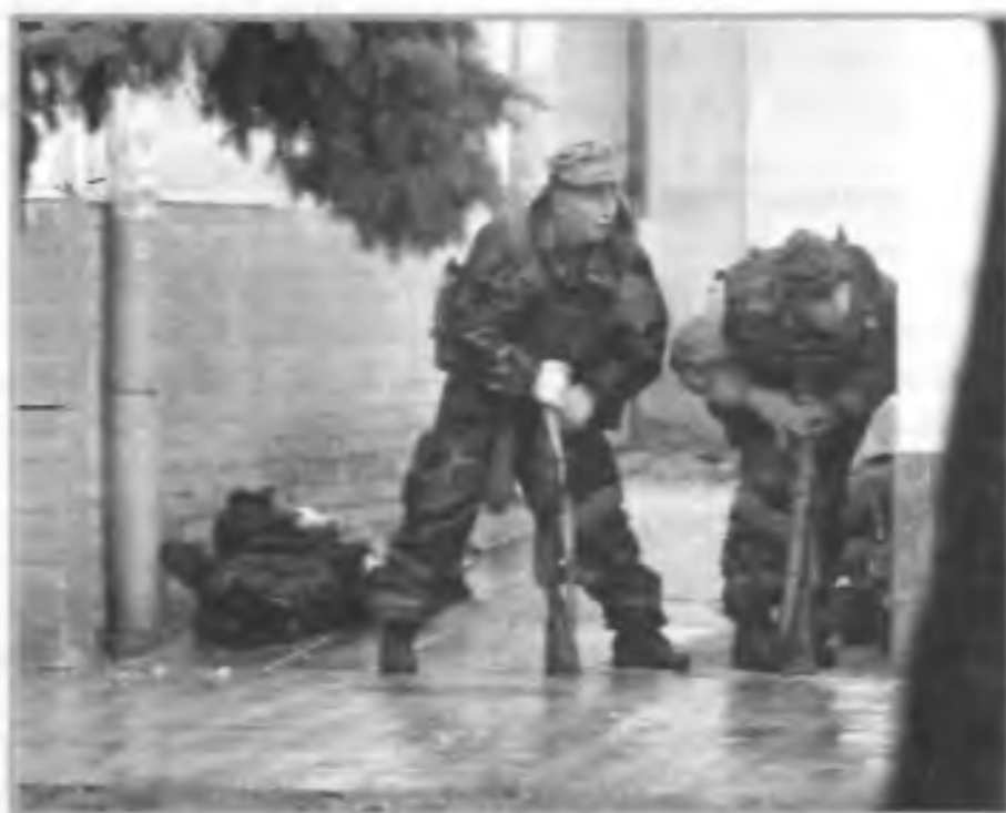
Антитеррористическая операция российских спецслужб в г. Нальчике (Кабардино-Балкария). 13 октября 2005 г.

Еще в конце XIX в. стало понятно, что без информации о подготовке террористических актов эффективной борьбы с террористами не получится. Поэтому в большинство организаций были внедрены агенты, ко-