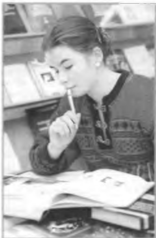
Старшеклассница готовится к вступительным экзаменам в один из вузов страны