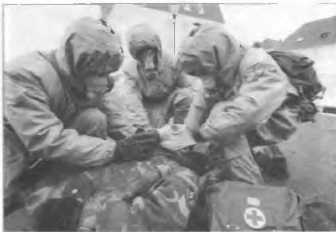
Практические занятия по гражданской обороне курсантов Академии гражданской защиты (Москва)