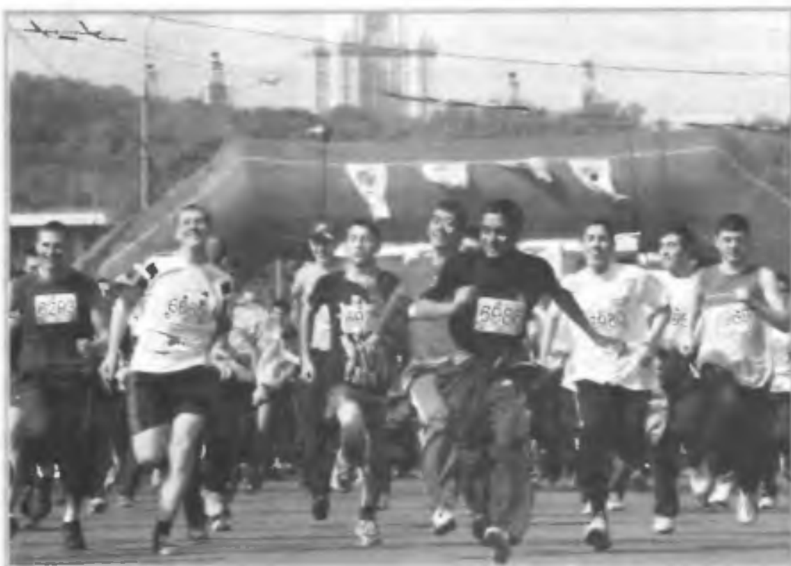
Участники молодежного марафона «Лужники». Москва, май 2004 г.