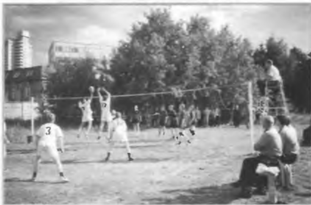
Школьные соревнования по волейболу