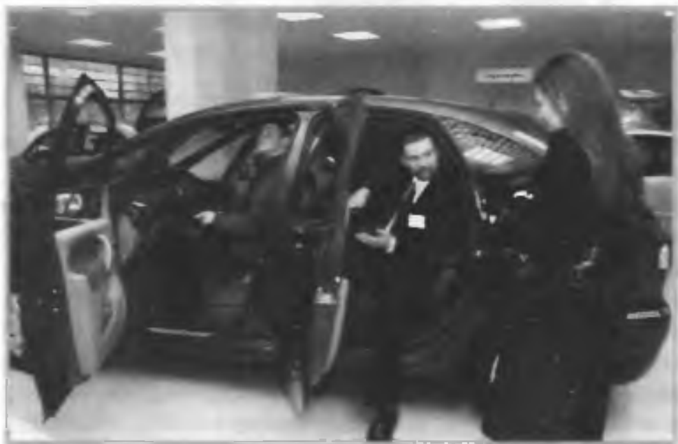
Супруги в автосалоне выбирают автомобиль

Материальный фактор определяется вкладом супругов в обеспечение жизнедеятельности семьи и зависит от того, насколько важна для каждого из супругов эта сторона брака.