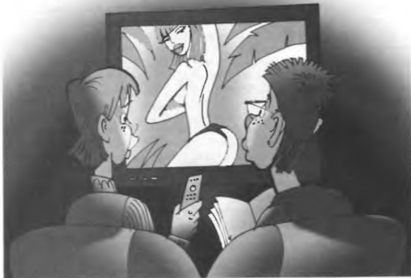
Просмотр подростками эротической сцены по телевизору