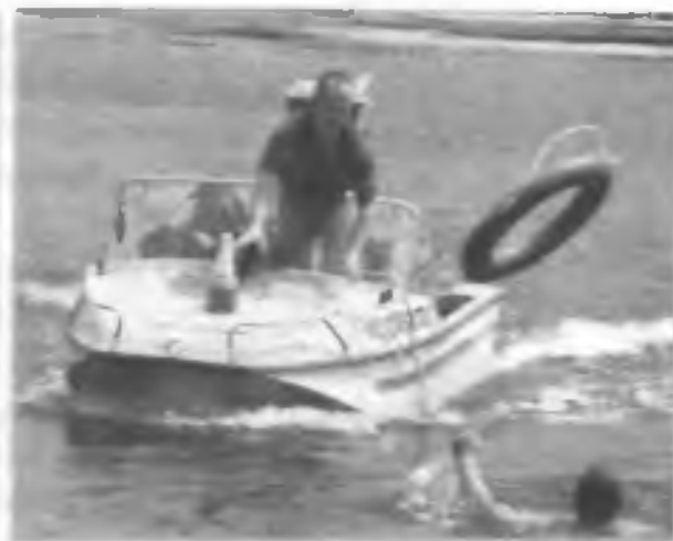
Тренировка спасателей по спасению утопающего человека. Москва, спасательная станция «Мещерская», июнь 2002 г.