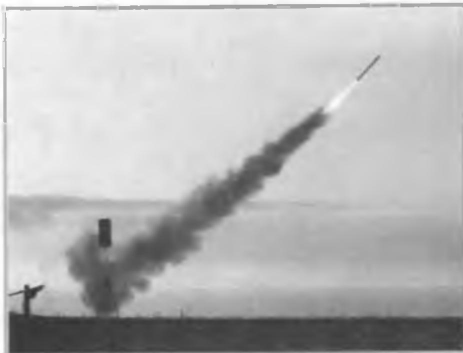
Испытание ПЗРК «Игла» на полигоне учебного центра войск ПВО.