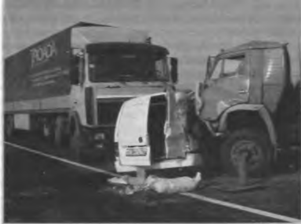
Дорожно-транспортное происшествие на 136-м километре федеральной трассы «Москва — Нижний Новгород» в районе населенного пункта Пекша. В результате столкновения 38 автомобилей погибло 4 человека и ранено 13. 4 октября 2005 г.