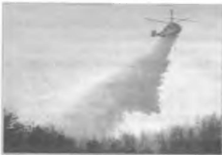
Тушение лесного пожара с воздуха