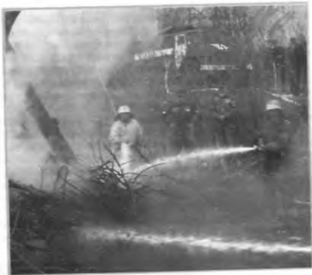
Противопожарные службы Подмосквья ведут борьбу с лесоторфяными пожарами. Апрель 2005 г.

подрыв экономики, гибель людей или ущерб их здоровью, ухудшение работы служб здравоохранения в масштабах, требующих чрезвычайной помощи извне.