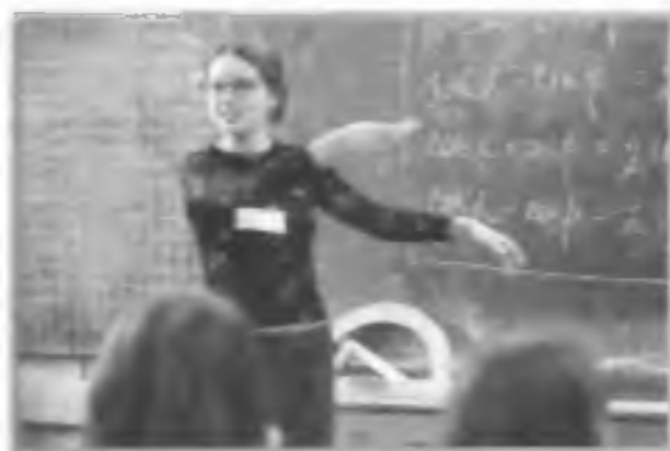
День самоуправления в московской школе № 124. Урок математики ведет одна из учениц