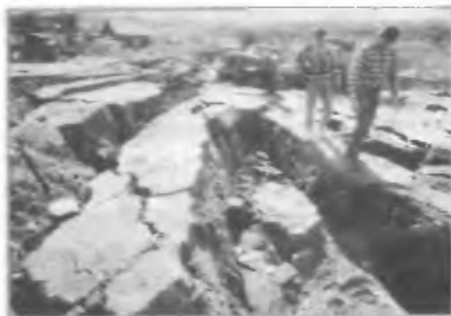
Разломы земной коры в результате землетрясения на Курилах. Остров Итуруп. Октябрь 1994 г.

Природные явления геологического характера порождают землетрясения. Только за десять лет (1994—2004 г.) на территории Российской Федерации их произошло более 120, причем два были сильнейшими, вызвали чрезвычайные ситуации 4 октября 1994 г. на Курилах и 27 мая 1995 г. в поселке Нефтегорск (Сахалин). Оба землетрясения привели к человеческим жертвам, сильным разрушениям объектов социальной и промышленной инфраструктуры.