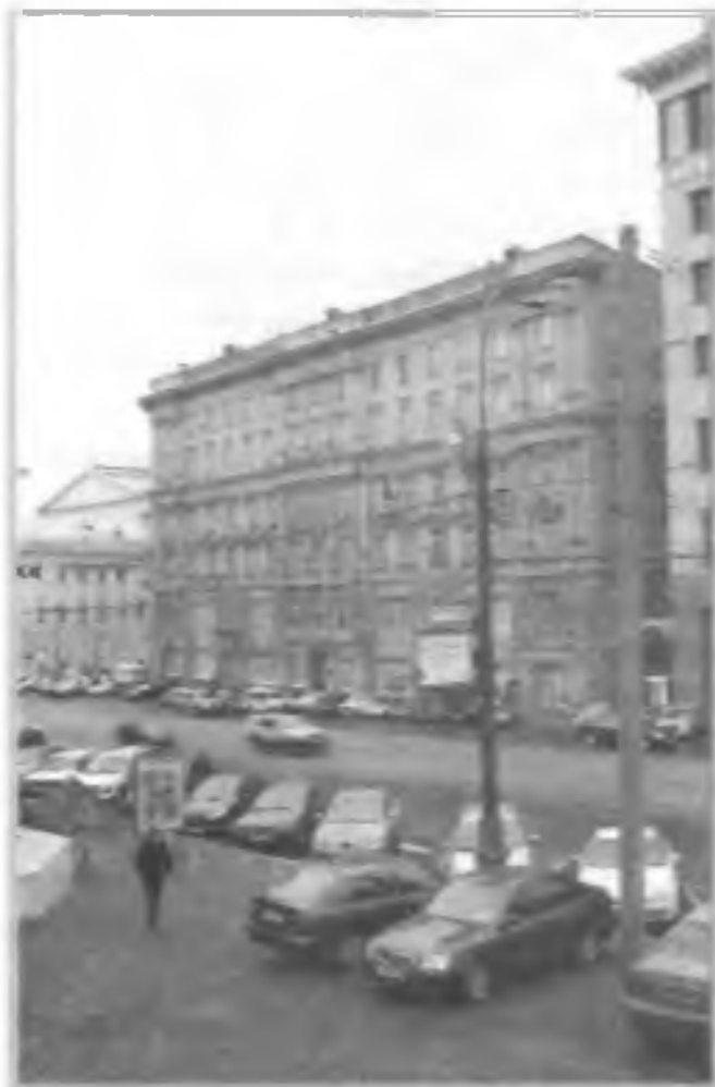
Фасад здания МЧС