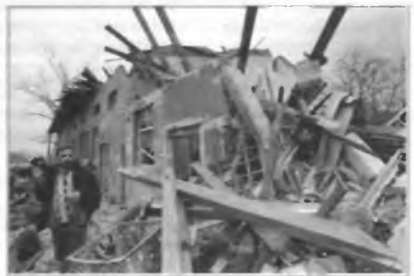
Разрушенная фабрика в г. Чачак в результате бомбардировки НАТО. Югославия, апрель 1999 г.