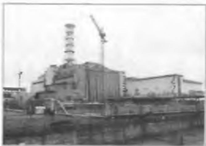
Саркофаг над четвертым энергоблоком Чернобыльской АЭС. 26 апреля 1986 г. здесь произошла самая крупная авария за всю историю атомной энергетики

Транспорт является источником опасности не только для его пассажиров, но и для населения, проживающего в зонах транспортных