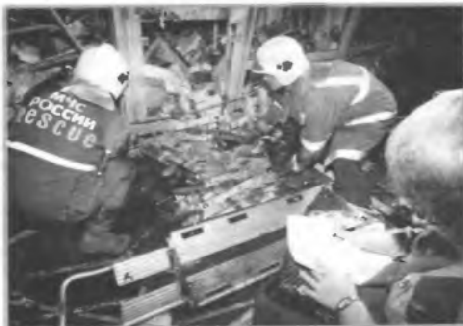
Специалисты МЧС разбирают завалы после взрыва в переходе на Пушкинской площади в Москве. Август 2000 г.