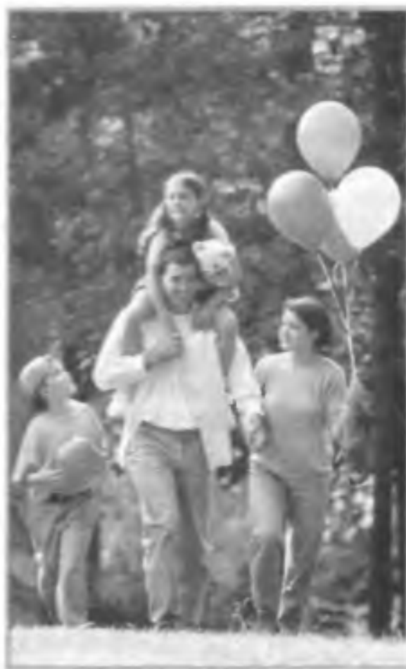
Прогулка на природе

Семейный кодекс РФ введен в действие с 1 марта 1996 г. Семейное законодательство РФ исходит из необходимости укрепления семьи, построения семейных отношений на чувствах взаимной любви и уважения, взаимопомощи и ответственности перед семьей всех ее членов, недопустимости произвольного вмешательства