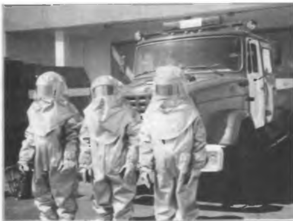
Пожарный расчет в боеготовности на заводе по уничтожению химического оружия в пос. Горный (Саратовская обл.)