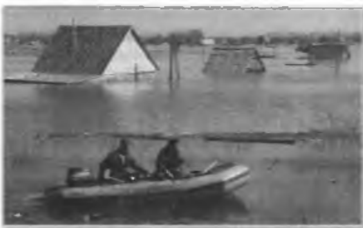
В связи с паводком на р. Тобол уровень воды поднялся на 9 м. Сотрудники МЧС патрулируют зоны затопления. Курган, апрель 2002 г.