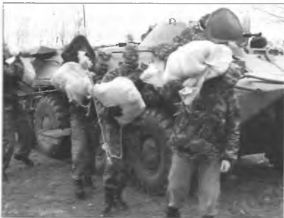
Задержание контрабандного груза наркотиков на таджикско-афганской границе российскими пограничниками из Пянджского погранотряда. Таджикистан, январь 2003 г.