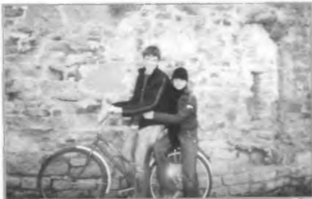
Мальчик с девочкой дружил...

Половое сближение, на которое идут подростки в надежде, что оно приведет к разрешению перечисленных выше проблем, руководствуются абсолютно неверными мотивами, а потом страдают от последствий. Интимные контакты между людьми, не до конца разобравшимися в роли любви и секса во взаимоотношениях, могут сильно повредить им обоим.