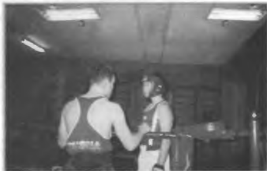
В спортивной секции. Наставления юному спортсмену дает опытный тренер