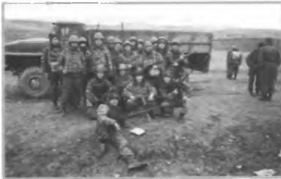
Подразделение войск МВД на территории Республики Чечня перед выходом на боевое задание

операции проводились чаще всего государственными органами против собственных террористических организаций, пытавшихся с помощью насилия захватить власть.