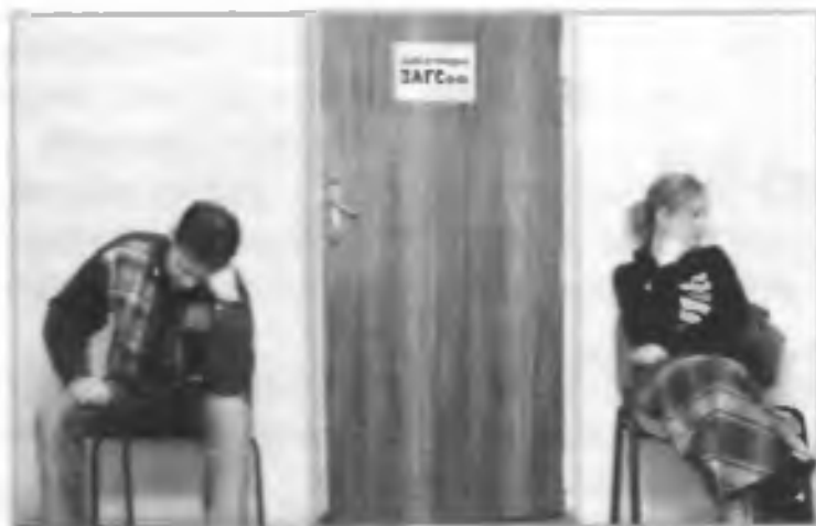
Нелегкое решение... Перед расторжением брака

становлением главы администрации по месту регистрации брака по просьбе лиц, вступающих в брак, с согласия законных представителей — родителей, усыновителей или попечителей. Брачный возраст может быть снижен и более чем на два года. Так, в силу статьи 3 Закона Ростовской области от 19 апреля 1996 г. «Об условиях и порядке регистрации брака несовершеннолетних граждан в Ростовской области» в виде исключения с учетом обстоятельств (беременность, рождение ребенка и т. д.) брачный возраст снижен до 14 лет.