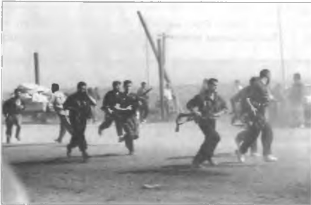
Боевики из незаконных вооруженных формирований в населенном пункте на территории Республики Чечня. 90-е гг. XX в.