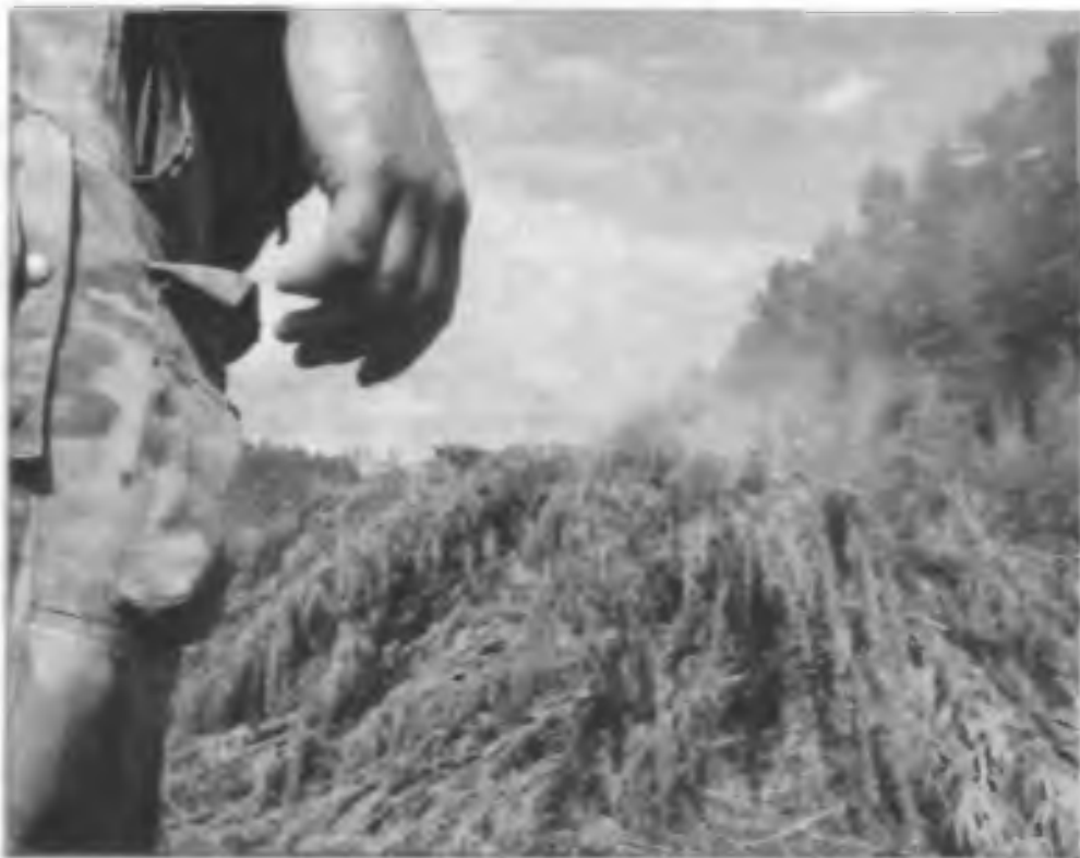
Уничтожение посевов конопли сотрудниками областного управления Госнарконтроля. Московская область, г. Железнодорожный, август 2004 г.