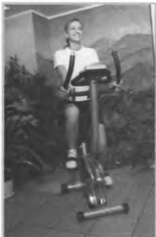
Занятия дома на спортивном тренажере