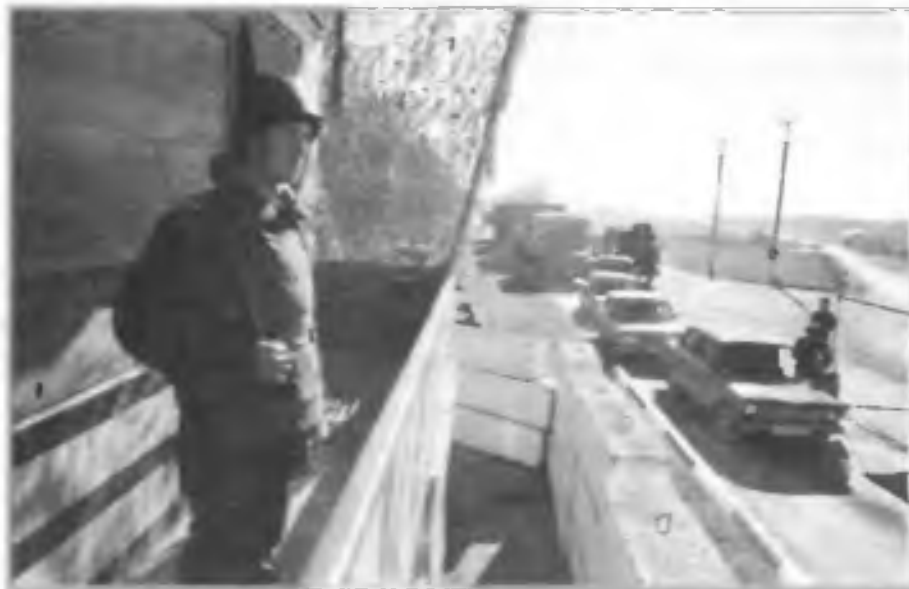
Блок-пост войск МВД на границе с Чечней. Ставропольский край. конец 90-х гг.

В настоящее время обеспечение национальной безопасности России от военных угроз только за счет политических возможностей (членства в международных организациях, партнерских отношений, возможности влияния) становится малозффективным.