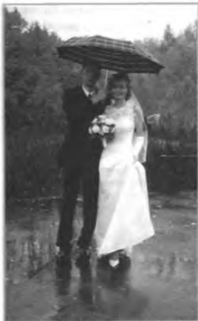
Снимок на память после торжественной регистрации брака во Дворце бракосочетания