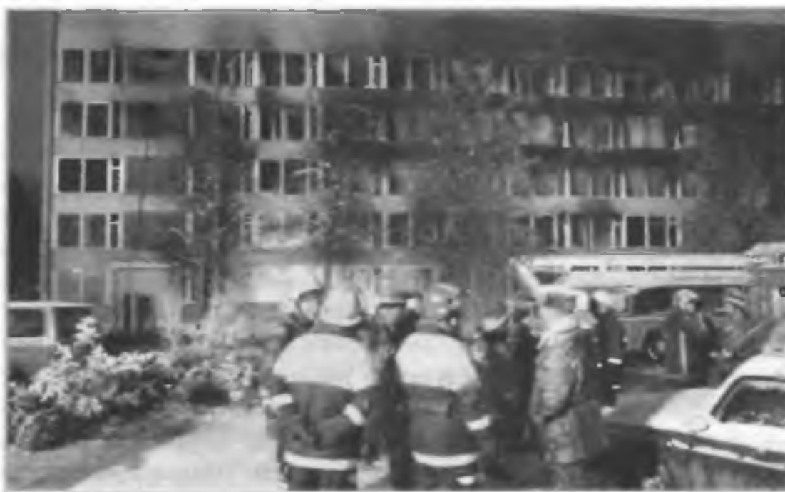
Пожарные расчеты у здания общежития Университета дружбы народов имени П. Лумумбы. Пожар произошел ночью в результате неисправности электропроводки. Площадь возгорания составила более 1000 м 2 . Имелись человеческие жертвы. Москва, 24 ноября 2003 г.