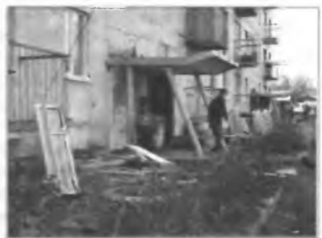
Последствия взрыва склада боеприпасов в п. Южные Коряки. Были разрушены несколько домов. Камчатка, октябрь 2005 г.