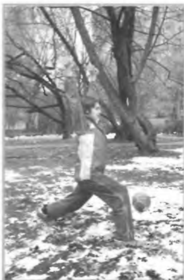
Самостоятельные занятия физкультурой на свежем воздухе