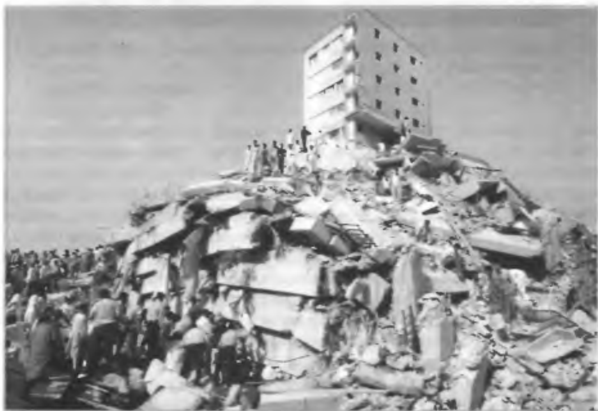
Мощное землетрясение в Пакистане. Погибли десятки тысяч человек. 9 октября 2005 г., Исламбад

Всемирная организация здравоохранения (ВОЗ) характеризует стихийные бедствия как происшествия, влекущие за собой разрушения,