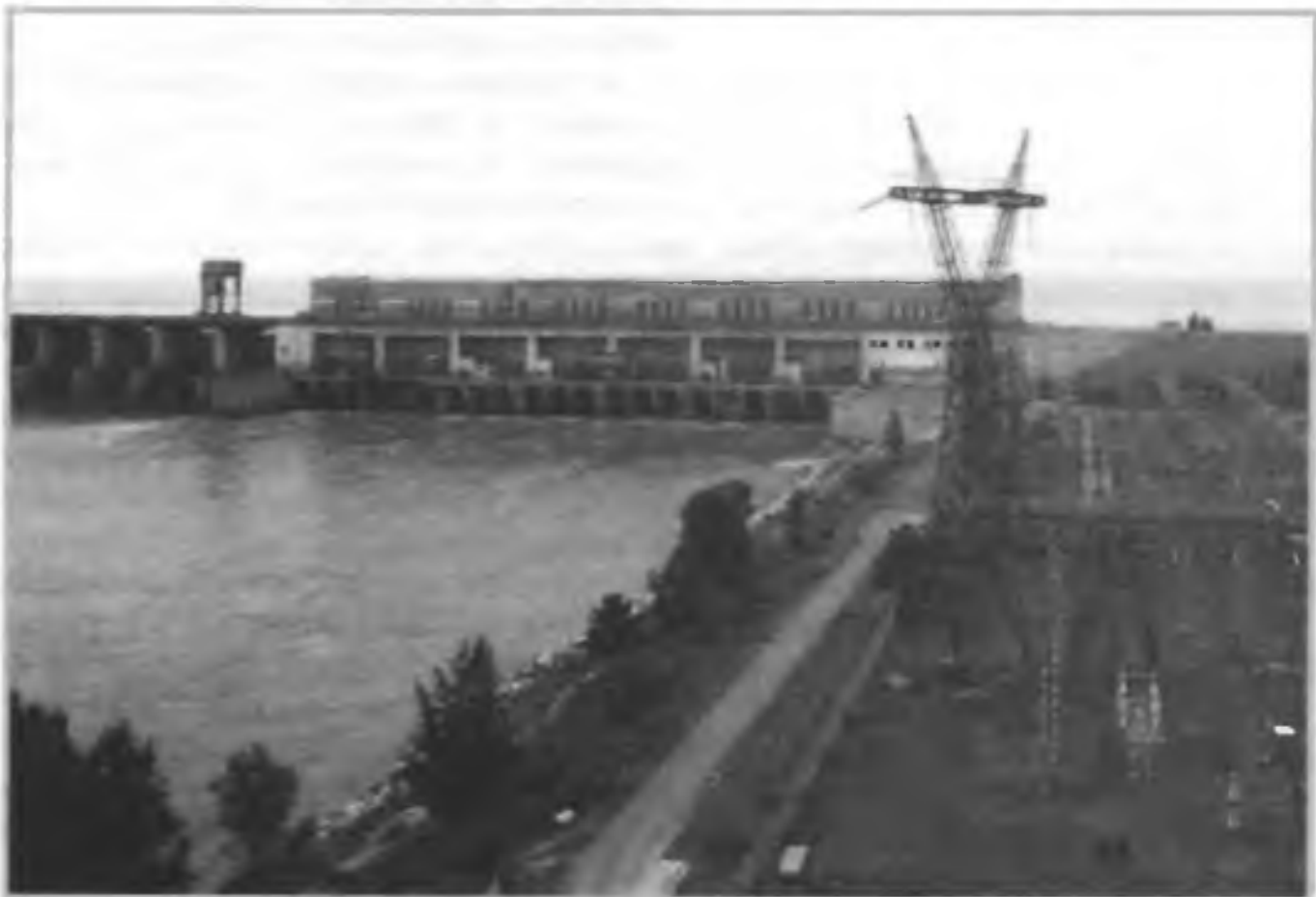
Гидротехнические сооружения: вверху слева направо — дамба, очистные сооружения; внизу — гидроэлектростанция

также сооружения, защищающие сушу и гидросферу от распространения других поверхностных загрязнений. Гидротехнические сооружения (плотины, шлюзы, насыпи, дамбы) используются также для защиты от наводнений. К этим мерам относятся берегоукрепительные работы. Важную роль в снижении ущерба окружающей природной среде играют создание и правильная эксплуатация коммунальных и промышленных очистных сооружений. Для уменьшения ущерба от оползней, селей, обвалов, осыпей, лавин применяются защитные инженерные сооружения на коммуни-