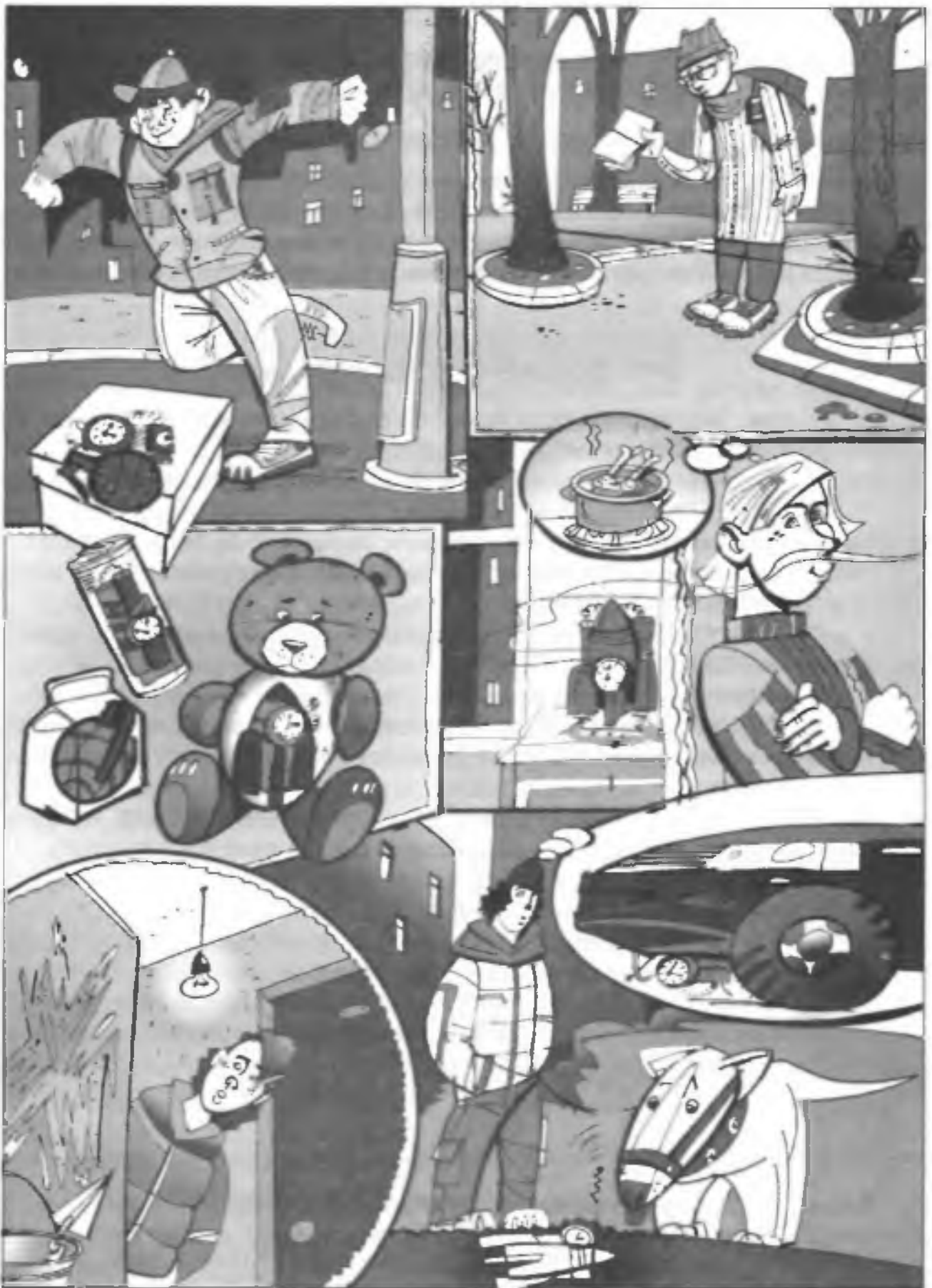
Примеры маскирования террористами взрывных устройств