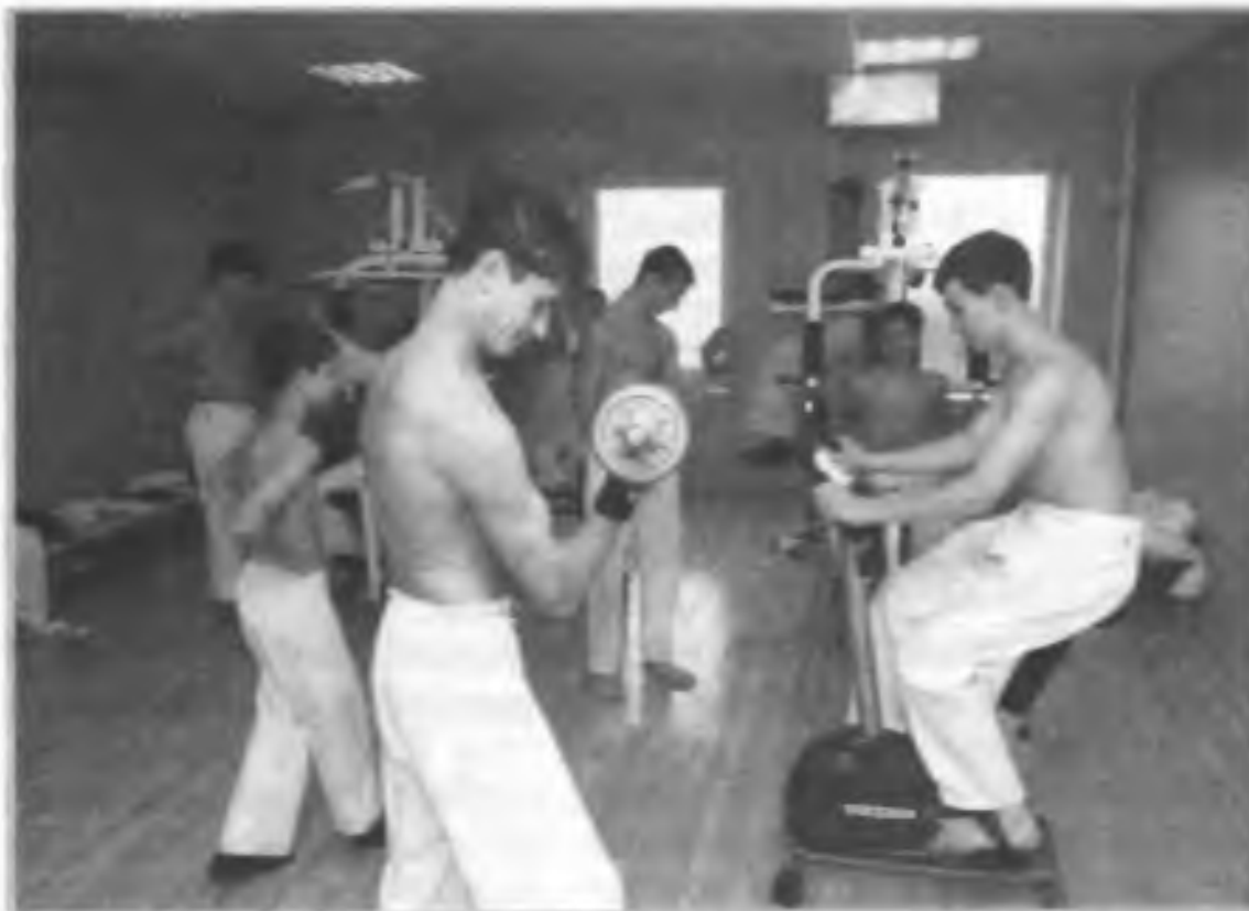
В тренажерном зале нового физкультурно-оздоровительного комплекса. Белгородская область