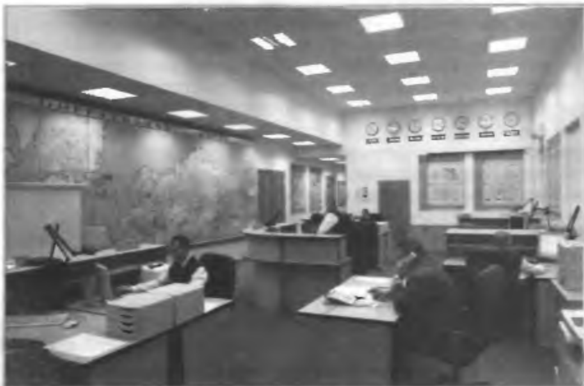
Диспетчерская центра управления по делам ГО и ЧС