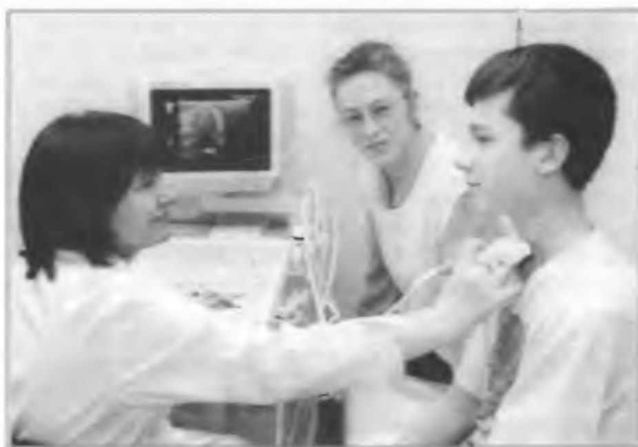
Диспансеризация во врачебно-физкультурном диспансере