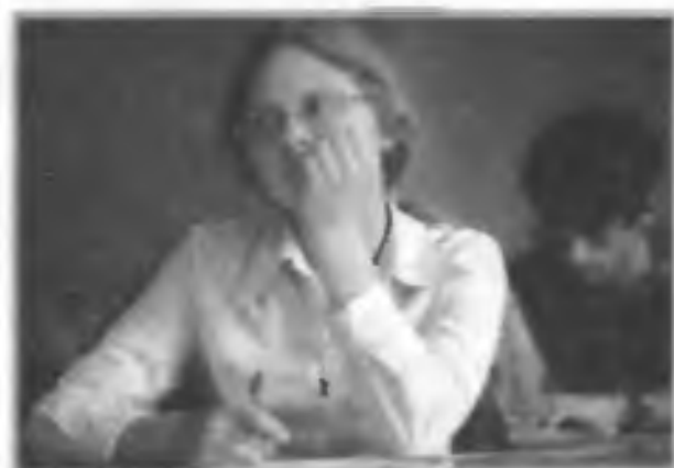
Идет письменный экзамен

Уровень духовного здоровья обеспечивается системой мышления человека, постоянным стремлением его к самовоспитанию, самообучению и совершенствованию духовных, физических и социальных качеств.