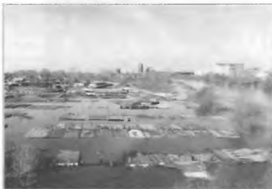
Пригородные поселки г. Кургана, затопленные в результате повышения уровня воды в р. Тобол. Апрель 2005 г.

Анализ чрезвычайных ситуаций на территории России за последний период показывает, что при сохраняющихся в целом показателях по времени и характерным районам возникновения лесных пожаров просматривается тенденция возрастания их масштабов, что выражается в постепенном росте количества чрезвычайных ситуаций территориального уровня и снижении количества чрезвычайных ситуаций локального уровня.