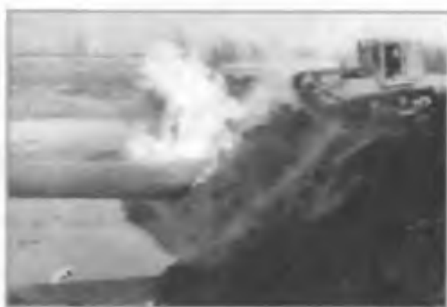
Авария на химически опасном объекте. Мощный взрыв повредил участок газопровода «Пермь — Горький». Ремонтно-восстановительные работы на месте взрыва. 10 декабря 2002 г.