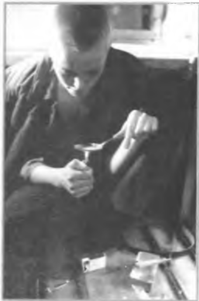
Юный наркоман со стажем

Наркомания — болезнь молодых. Она выбивает из нормальной жизни самых дееспособных.