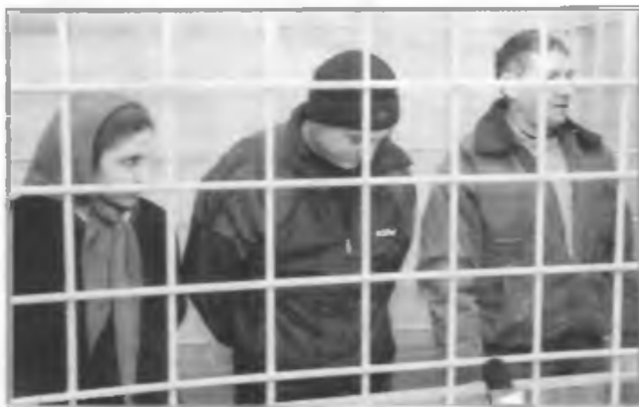
Члены преступной группы по торговле запрещенными веществами в зале суда. Они перевозили в Россию наркотики из ближнего зарубежья с целью сбыта.

В Уголовном кодексе РФ предусмотрены наказания за действия, связанные с наркотическими и психотропными веществами.