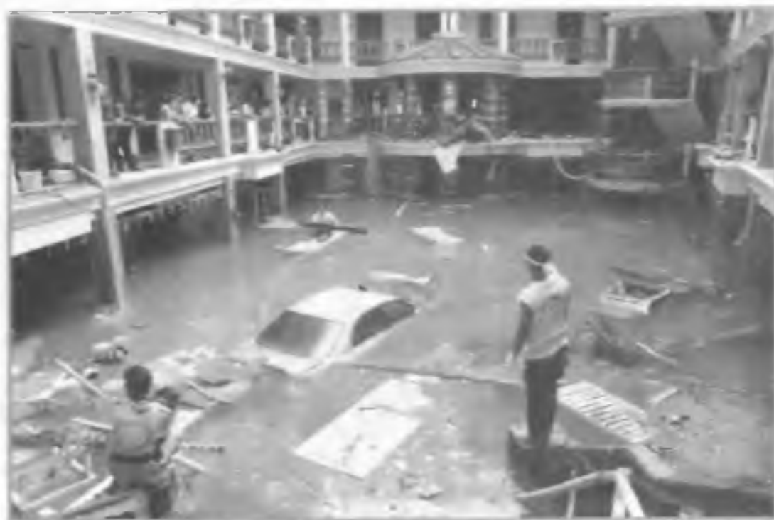
После цунами на территории одного из отелей в Индонезии. Январь 2005 г.

В России наиболее подвержены воздействию цунами восточное побережье Камчатки и Курильских островов, остров Сахалин и побережье Тихого океана. Имея большую скорость перемещения и огромную массу воды, цунами обладает колоссальной разрушительной силой.