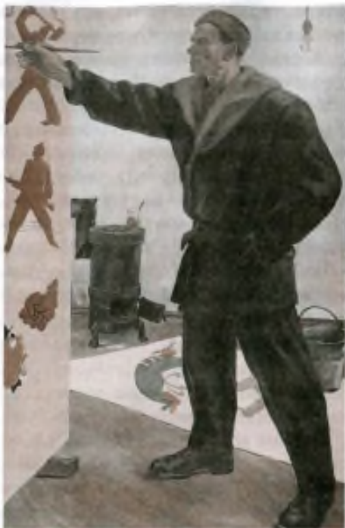
В. Маяковский в РОСТА.