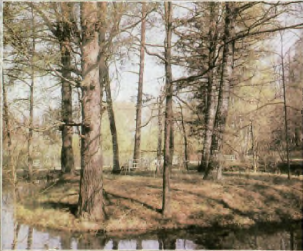
Михайловское. «Остров уединения»

Мне ни к чему одические рати И прелесть элегических затей. По мне, в стихах всё быть должно некстати, Не так, как у людей.