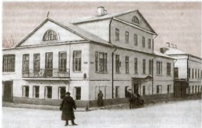
Дом Грибоедовых на Новинском бульваре в Москве. Фотография. Конец XIX в.