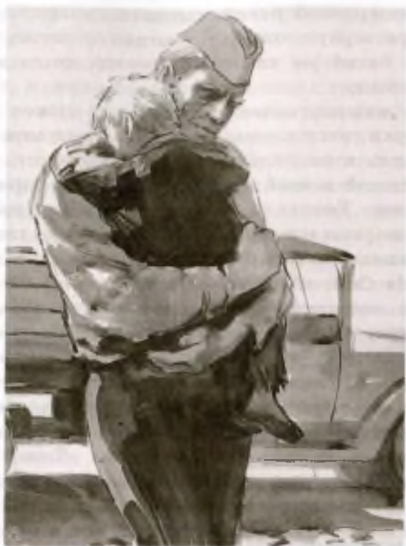
«Судьба человека». Художники Кукрыниксы

и спросил, как выдохнул: «Кто?» Я ему и говорю так же тихо: «Я — твой отец».