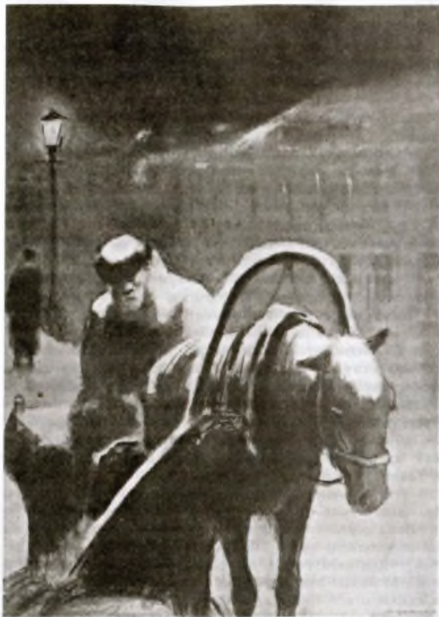
«Тоска». Художники Кукрыниксы