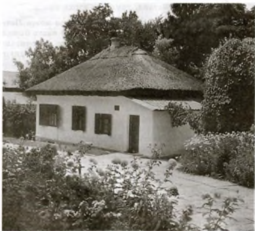
Мемориальный музей «Домик Лермонтова» в Пятигорске. Фотография

Пятигорские впечатления легли в основу повести «Княжна Мери», где описаны многие достопримечательные места города и окрестностей. На страницах повести мы встречаем упоминание о гроте Дианы, на площадке перед которым по вечерам собиралось