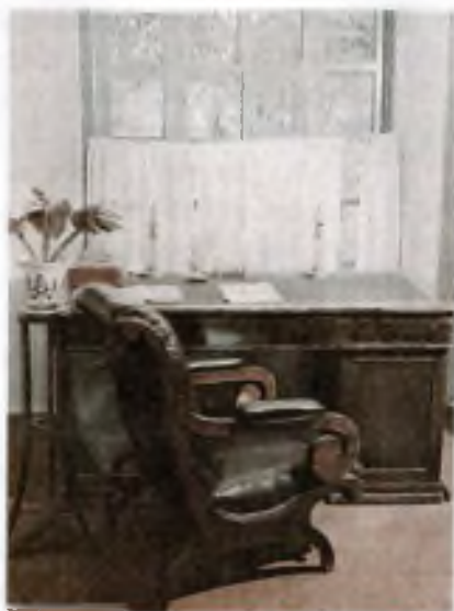
Кабинет М. Ю. Лермонтова в мемориальном музее в Пятигорске. Фотография

«водяное общество» Пятигорска. Попала на страницы повести и «золова арфа», беседка, внутри которой в деревянном футляре были установлены две арфы, начинавшие звучать при порыве ветра. От беседки открывалась живописная панорама города и окрестностей, поэтому это место было избрано отдыхающими для прогулок между процедурами. По утрам отдыхающие собирались перед существующей до наших дней галереей пить лечебную воду. Лермонтов упоминает реально существовавший магазин Челахова и другие приметы хорошо знакомого ему города. Видимо, тогда же поэт начал работу над живописным полотном «Вид Пятигорска».