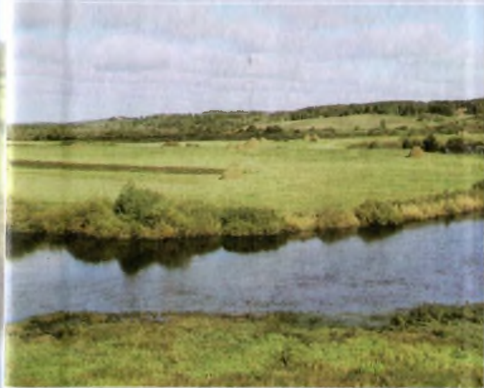
Вид с Тригорского халма