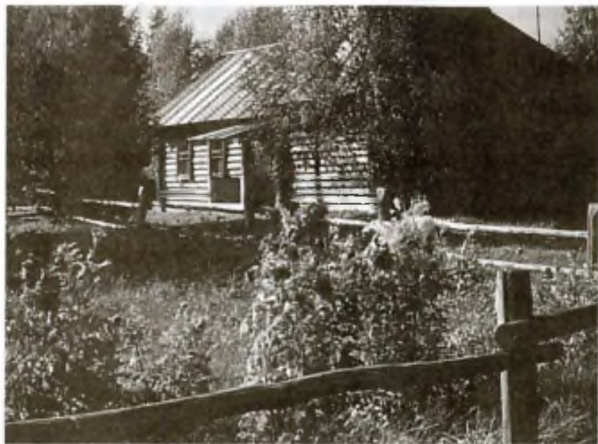
Дом Твардовских в Загорье. Фотография

торый был куплен отцом поэта Трифоном Гордеевичем через Земельный банк с выплатой в рассрочку. Этот клочок земли теперь известен как «поэтическое Загорье» — малая родина поэта, «начало всех начал».