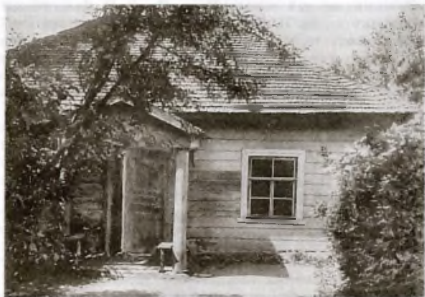
Михайловское. Домик няни. Фотография