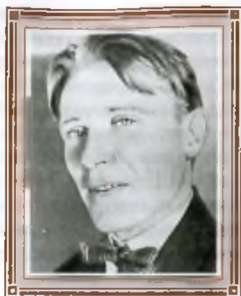
Михаил Афанасьевич БУЛГАКОВ (1891—1940)