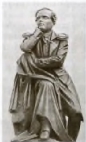
Памятник М. Ю. Лермонтову в Пятигорске. Скульптор А. М. Опекушин

дых офицеров. Здесь и произошла роковая ссора с Мартыновым, которая закончилась дуэлью с трагическим финалом.