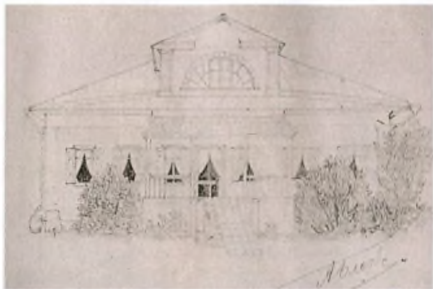
Старый дом в Шахматове (построен около 1812 г.). Рисунок А. Блока. 3 июня 1900 г.

...леса, поляны, И перелески, и шоссе, Наша русская дорога, Наши русские туманы, Наши шелесты в овсе...»