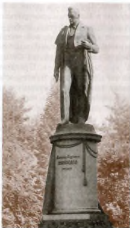
Памятник А. С. Грибоедову в Москве. Скульптор А. А. Мануйлов

После успешного окончания пансиона он в 1806 году поступил в Московский университет, где за шесть с половиной лет завершил курс трех факультетов: словесного, юридического, естественно-математического. Преподаватели словесного факультета, у которых учился Грибоедов, были активными участниками литературной жизни Москвы. Так, профессор М. Т. Каченовский в 1805—1807 годах редактировал литературно-политический журнал «Вестник Европы», основанный Н. М. Карамзиным. Постоянным сотрудником «Вестника Европы» был профессор А. Ф. Мерзляков, талантливый поэт и литературный критик, автор популярной на протяжении двух столетий песни «Среди долины ровныя...».