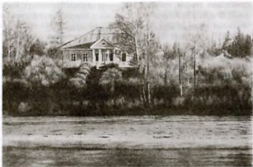
Михайловское. Дом-музей А. С. Пушкина. Фотография