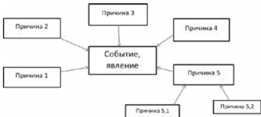
Схема 2. Причинно-следственные связи

По завершении работы вожатый предлагает участникам представить свои карты.