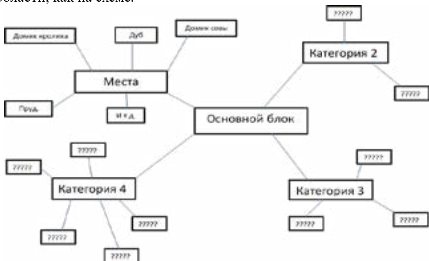
Схема 1. Кластерный метод

ватмана необходимо написать основную идею в рамочке «Ослик потерял хвост». Далее участники заполняют кластер и связанные с ним области, как на схеме.